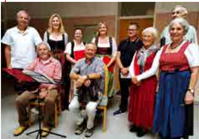
Sozialkaffee Rainfelder Sängerrunde 5. Oktober 2023