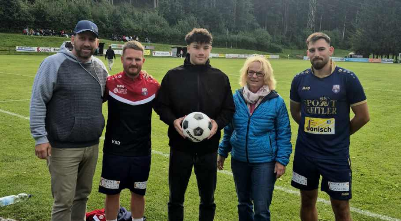
Die SPÖ St. Veit stellte sich beim ersten Meisterschaftsspiel der SG Traisen/St. Veit mit einer Ball- und Bierspende ein.