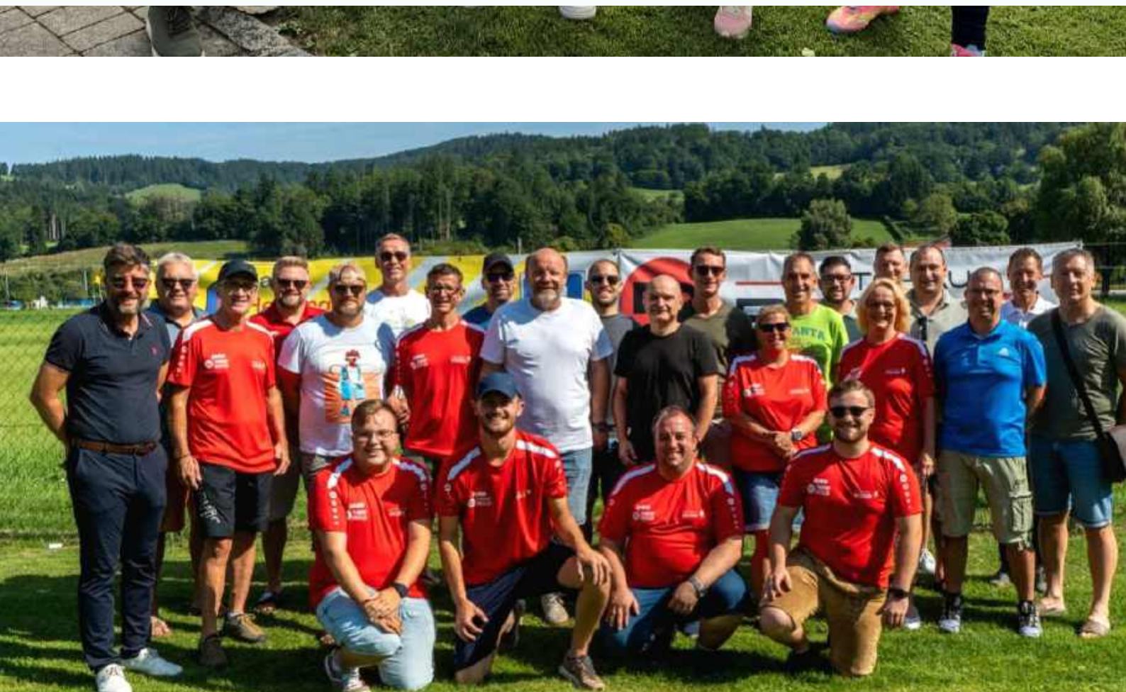
Zahlreiche Ehrengäste fanden sich beim 17. Rudolf Steurer Gedenkturnier am Sportplatz ein