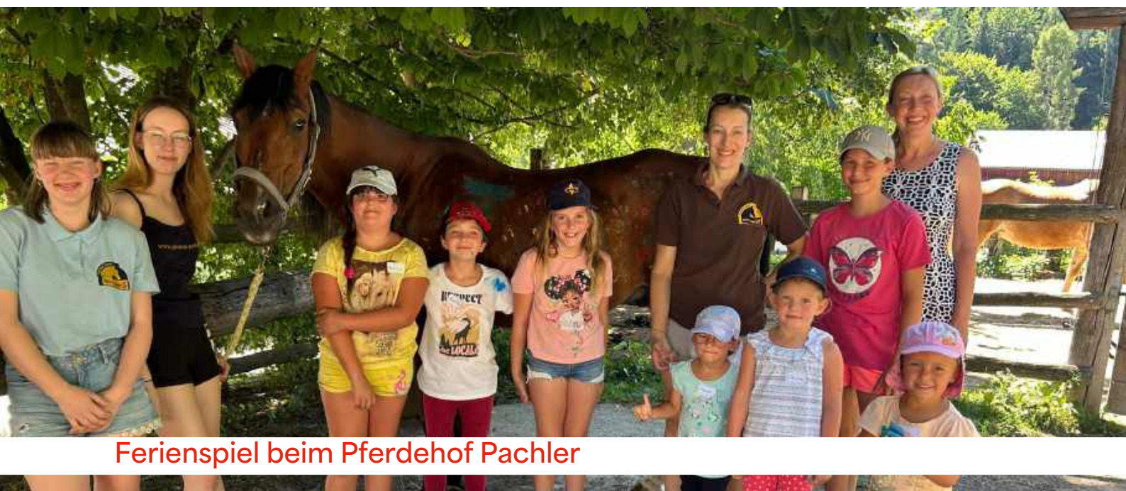
Ferienspiel beim Pferdehof Pachler