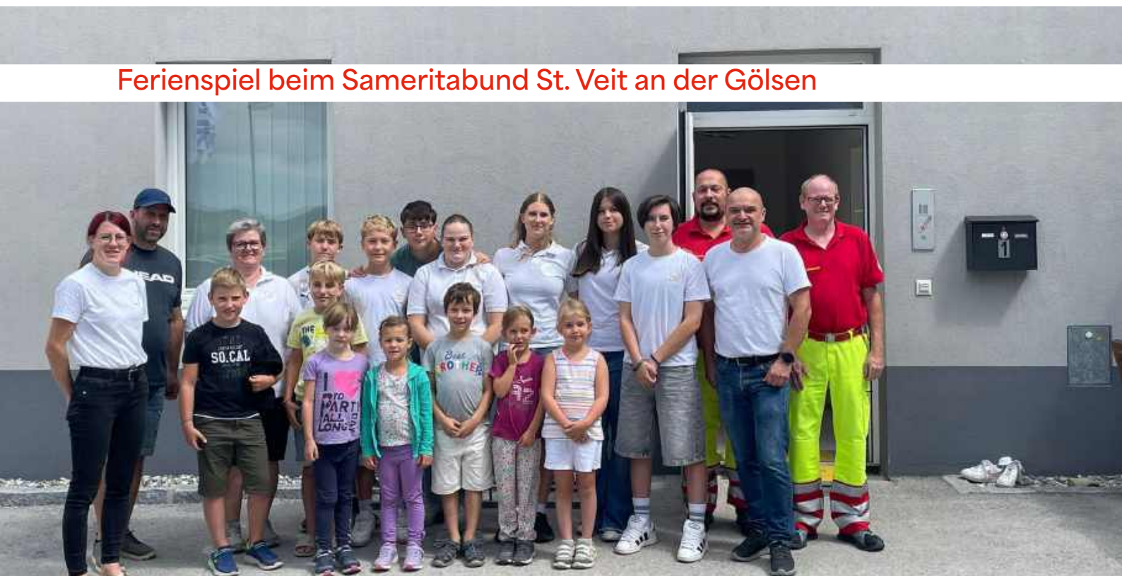
Ferienspiel beim Sameritabund St. Veit an der Gölsen