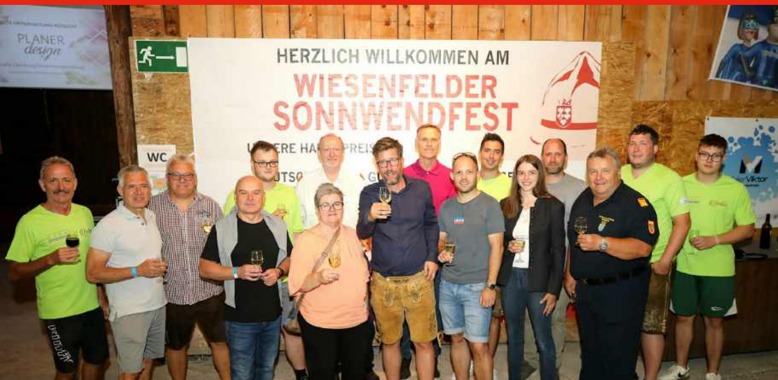
Tolle Stimmung herrschte bei unseren beiden Feuerwehrfesten in Rainfeld und Wiesenfeld.