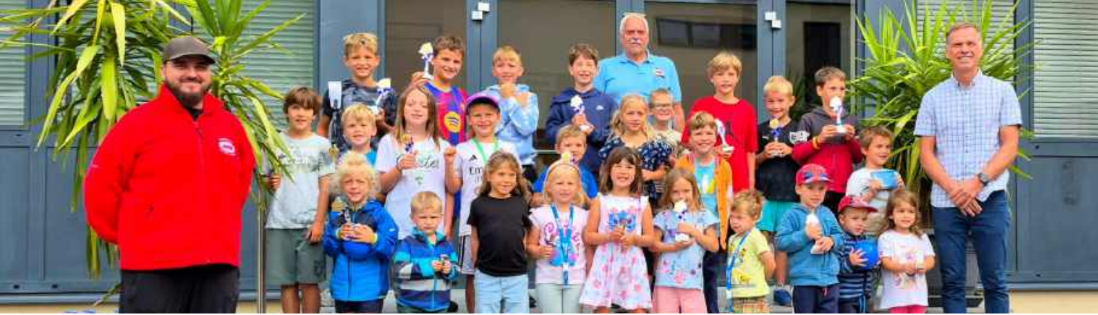
Die glücklichen Gewinner beim Arbö Gokart Rennen im Rahmen des St. Veiter Ferienspiels