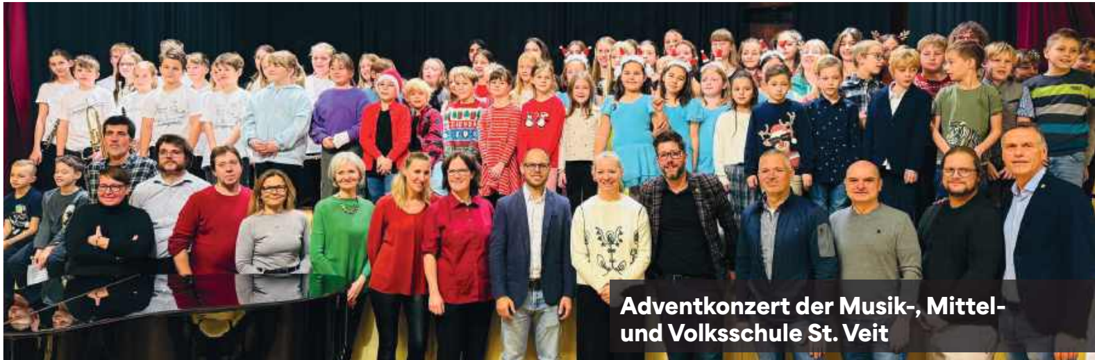
Adventkonzert der Musik-, Mittel- und Volksschule St. Veit