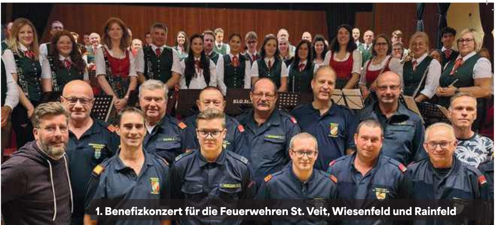
1. Benefizkonzert für die Feuerwehren St. Veit, Wiesenfeld und Rainfeld

Gemeindeamt standen die Beamten für Fragen und Anliegen zur Verfügung – eine wertvolle Gelegenheit, die Arbeit der Polizei näher kennenzulernen und Vertrauen aufzubauen.