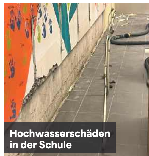
Hochwasserschäden in der Schule

sich persönlich ein Bild von den Leistungen der Schule zu machen. Abgerundet wurden die Aktivitäten durch das traditionelle Laternenfest im Kindergarten Rainfeld.