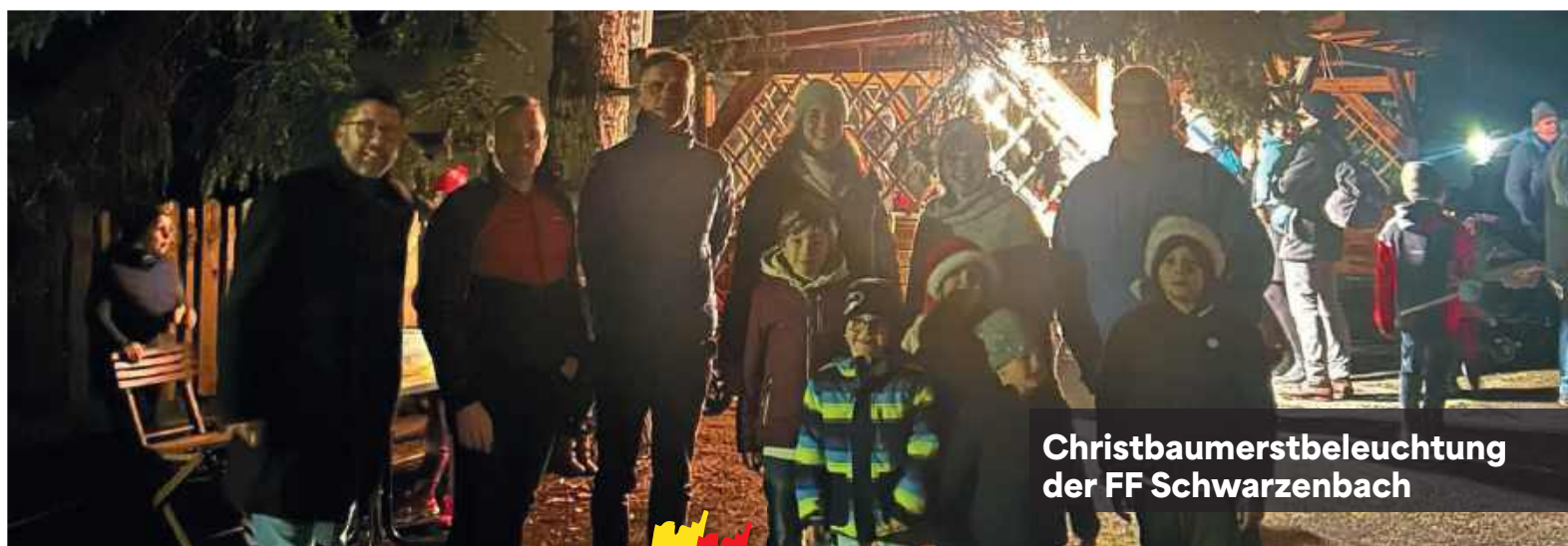
Christbaumerstbeleuchtung der FF Schwarzenbach

Vom Leben der Holzknechte im Gölsental über die Ortsgeschichte und Wirtshauskultur bis hin zur Industriegeschichte der Ofenfabrik Swoboda in Rainfeld – die Filme brachten längst vergangene Zeiten