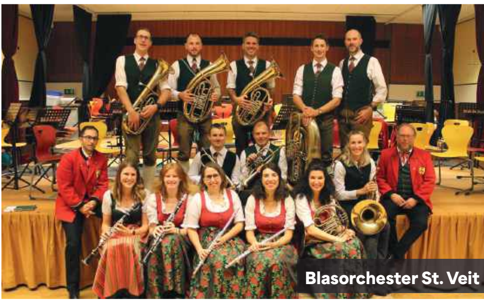
Blasorchester St. Veit