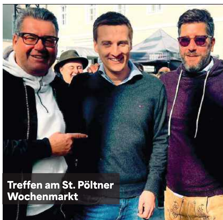
Treffen am St. Pöltner Wochenmarkt