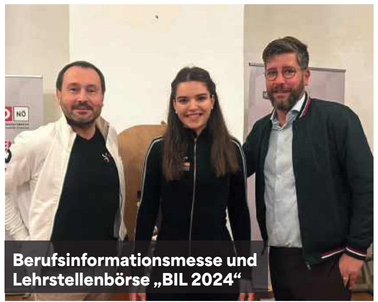
Berufsinformationmesse und Lehrstellenbörse „BIL 2024“