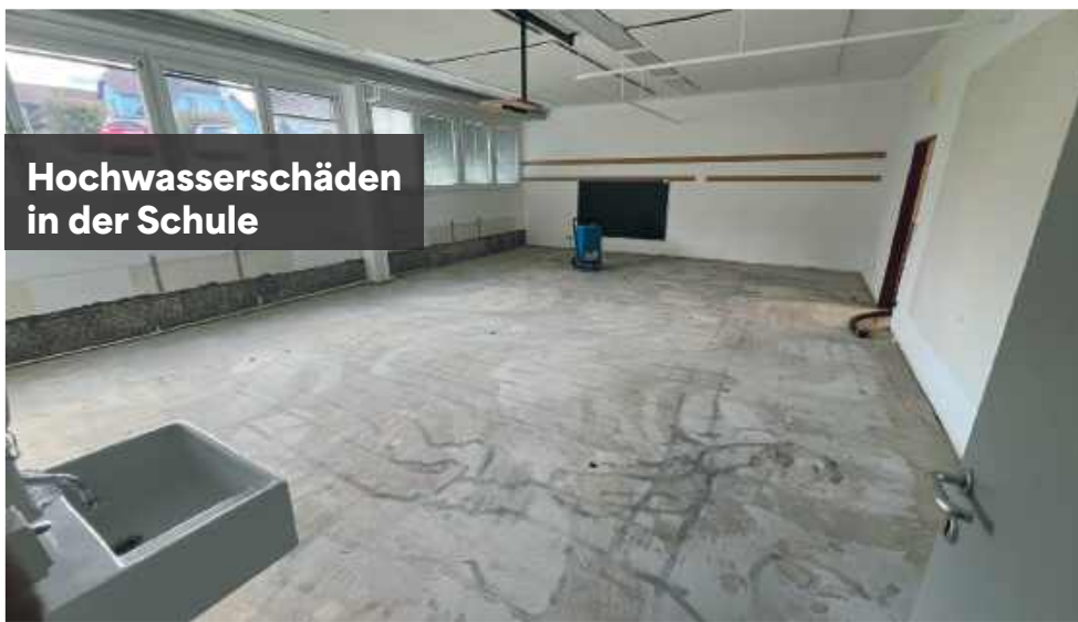
Hochwasserschäden in der Schule