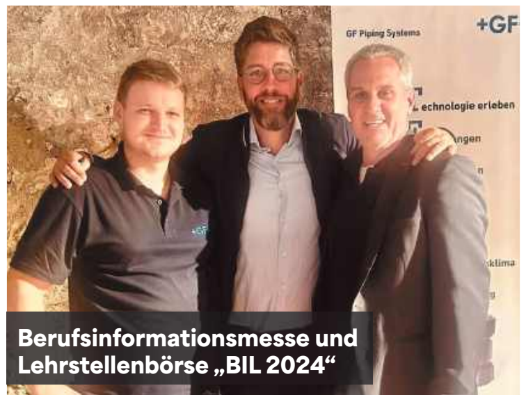
Berufsinformationmesse und Lehrstellenbörse „BIL 2024“