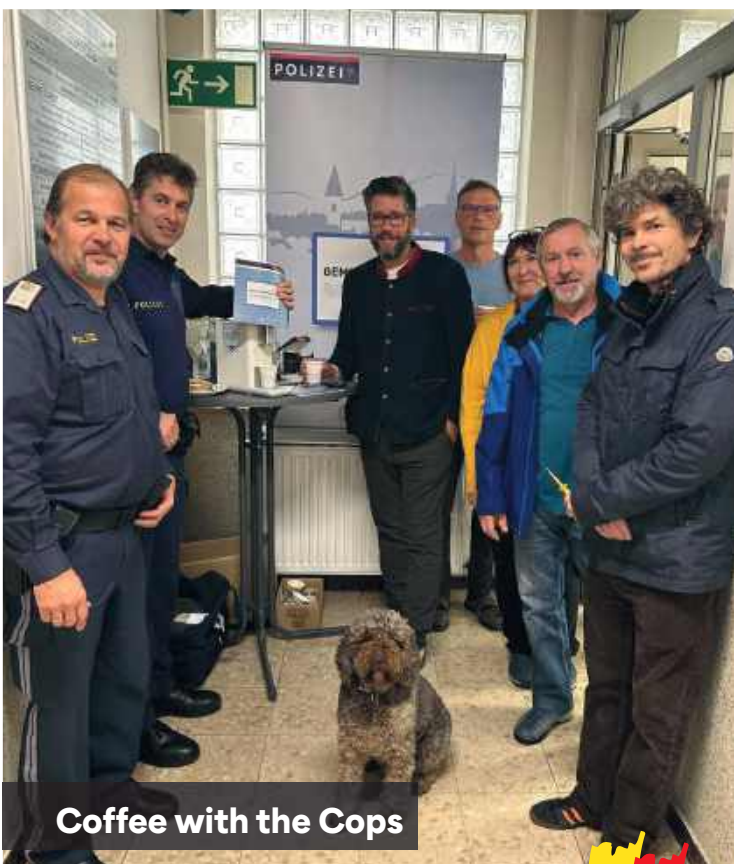
Coffee with the Cops