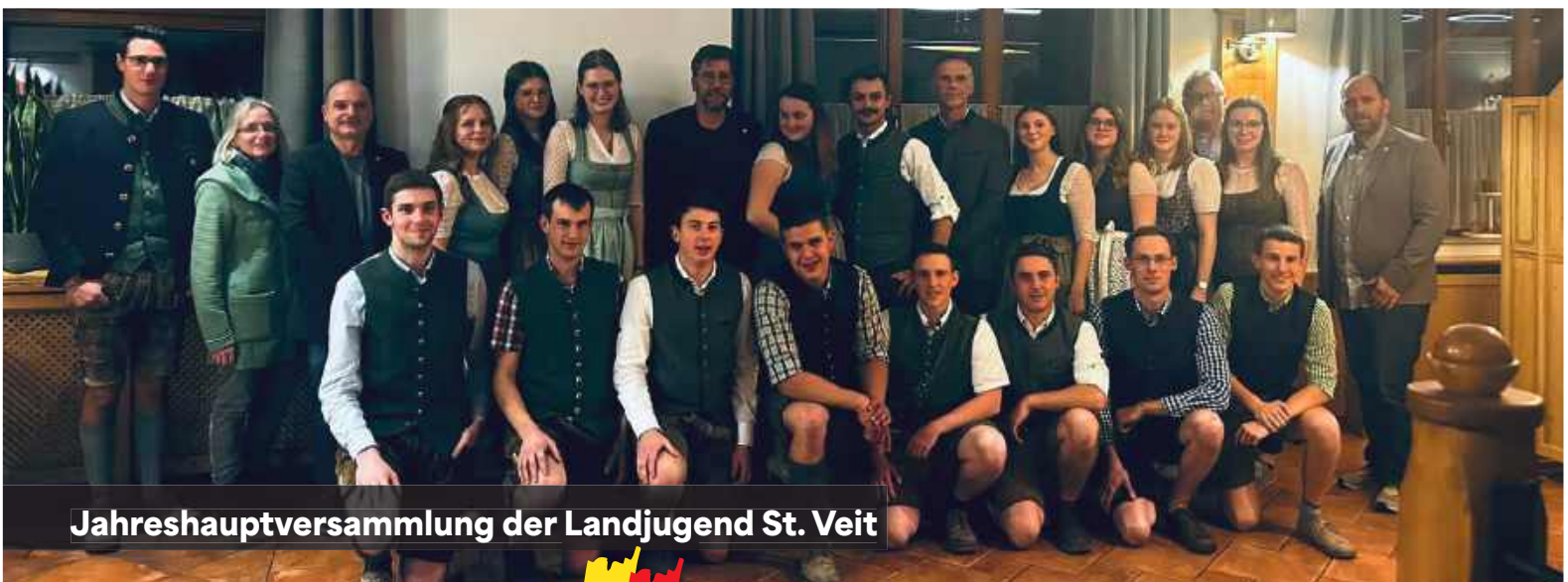
Jahreshauptversammlung der Landjugend St. Veit

Ein großes Dankeschön gilt auch dem ULC Transfer , der mit seinem Engagement das St. Veiter Vereinsleben bereichert. Wir sind stolz auf die Vielfalt und das Zusammenwirken in unserer Gemeinde!