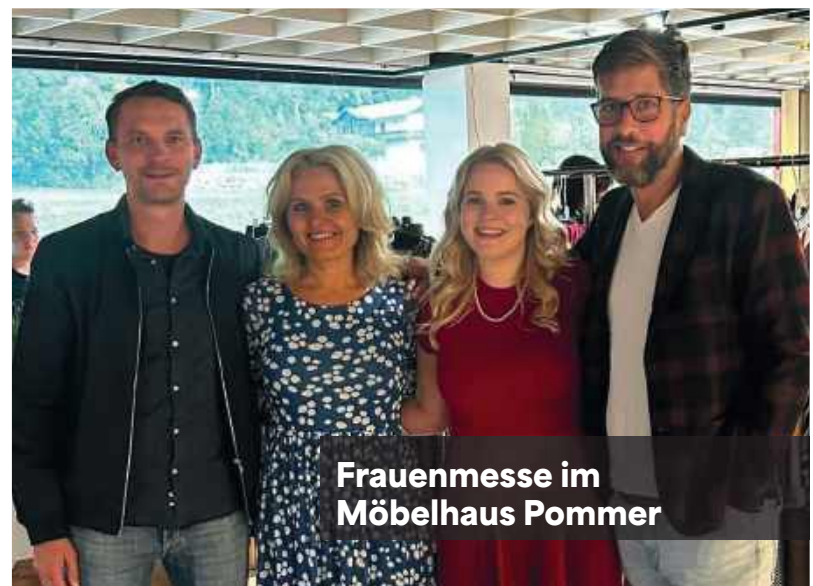
Frauenmesse im Möbelhaus Pommer