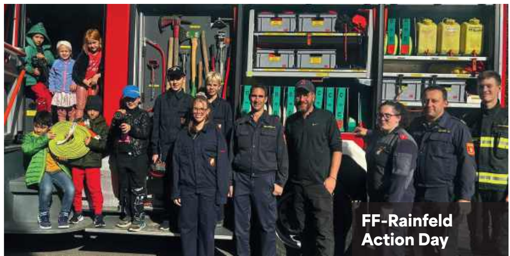
FF-Rainfeld Action Day

Ob Feuerwehr , Samariterbund oder Polizei – ihre Arbeit geht weit über Einsätze hinaus. Sie sind das Rückgrat unserer Gemeinde und stehen immer für uns bereit. Ein großes Danke an alle, die ihre Freizeit und Energie für St. Veit einsetzen!