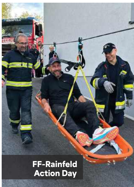
FF-Rainfeld Action Day

Auch die Polizei trug mit „Coffee with the Cops“ dazu bei, den Dialog mit der Bevölkerung zu fördern. Im