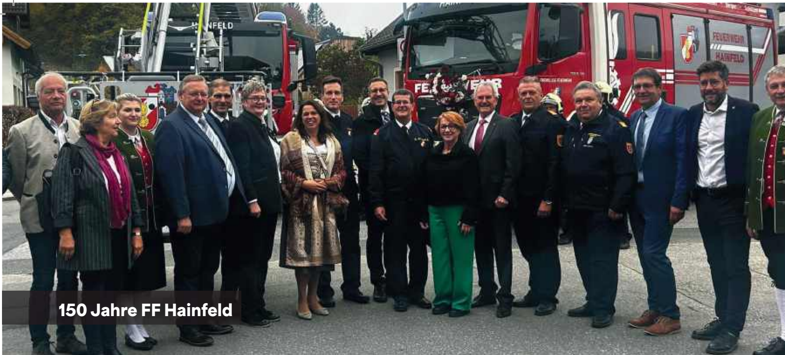
150 Jahre FF Hainfeld