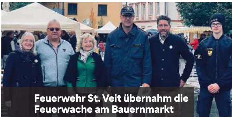
Feuerwehr St. Veit übernahm die Feuerwache am Bauernmarkt