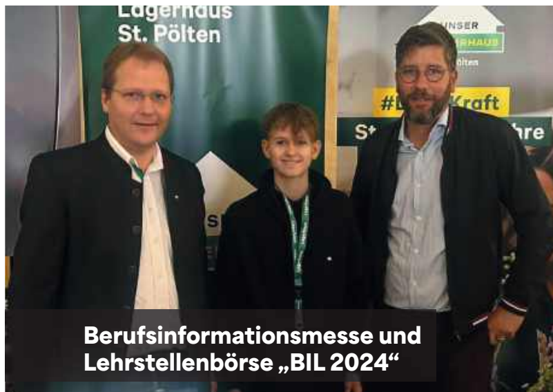
Berufsinformationmesse und Lehrstellenbörse „BIL 2024“