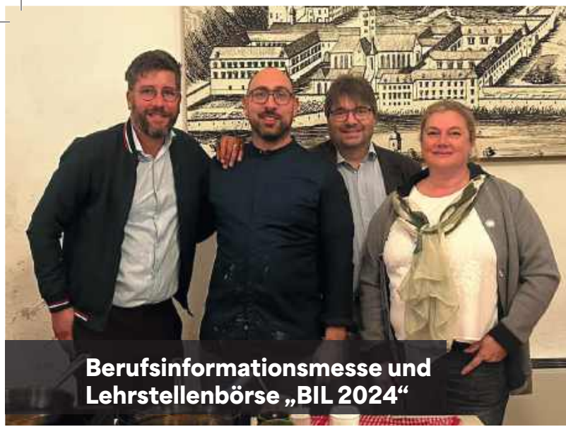
Berufsinformationmesse und Lehrstellenbörse „BIL 2024“