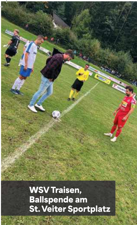
WSV Traisen, Ballspende am St. Veiter Sportplatz