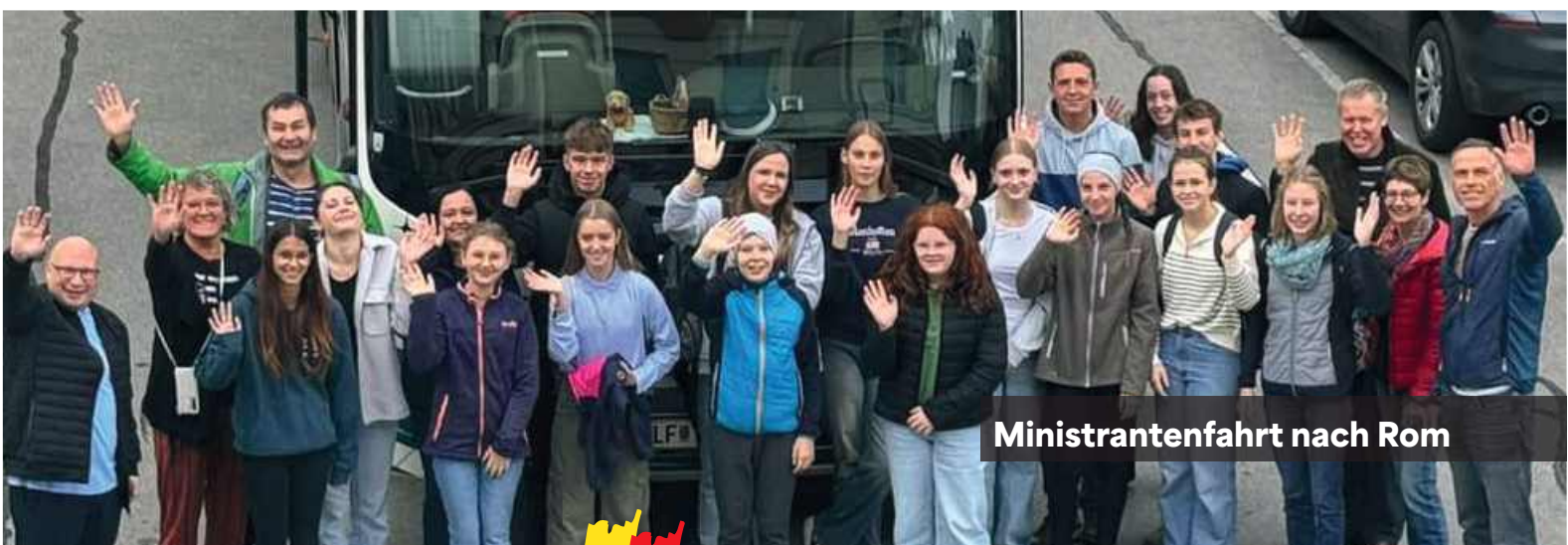
Ministrantenfahrt nach Rom