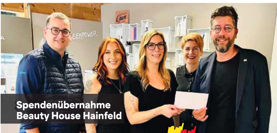
Spendenübernahme Beauty House Hainfeld

Ob regional, sozial oder politisch – Unser Bürgermeister zeigt sich als verlässlicher Vertreter seiner Gemeinde und des Bezirks, der auch über die Gemeindegrenzen hinaus aktiv ist.