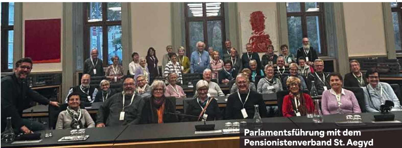
Parlamentsführung mit dem Pensionistenverband St. Aegydt