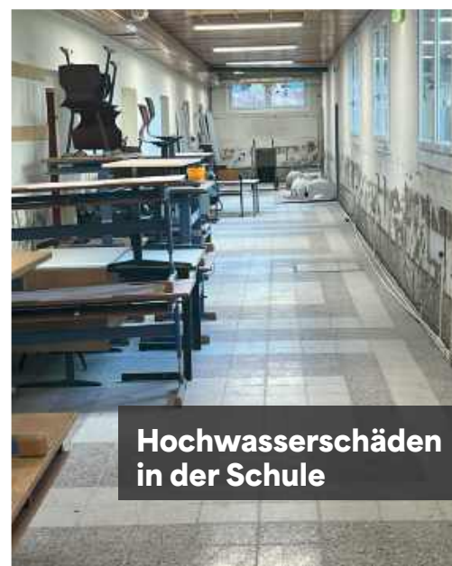
Hochwasserschäden in der Schule