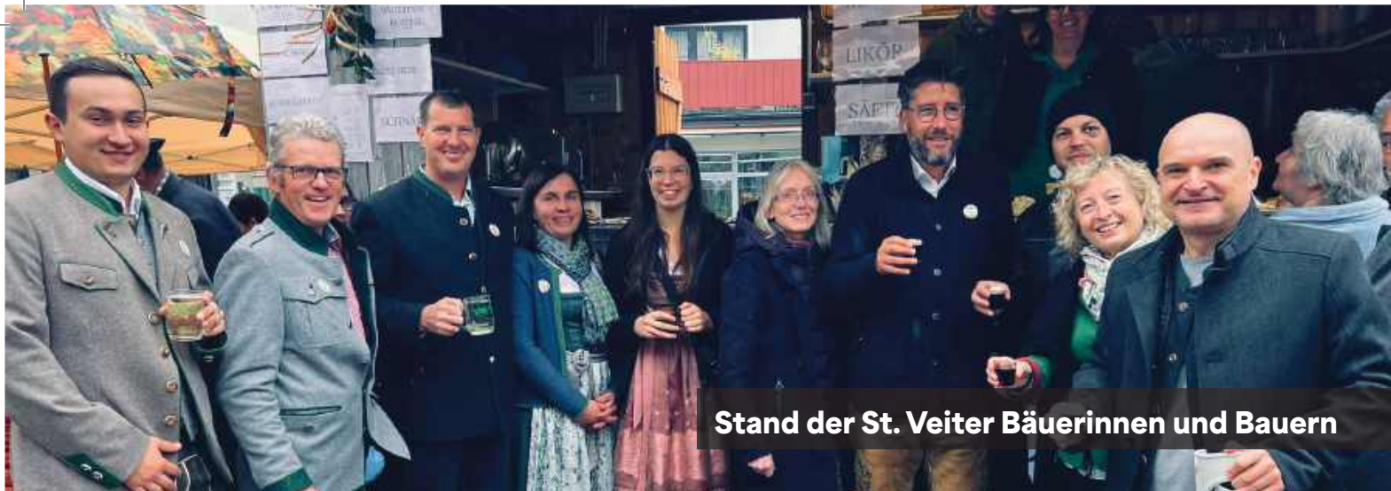
Stand der St. Veiter Bäuerinnen und Bauern