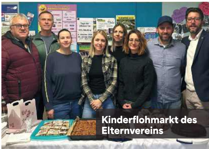
Kinderflohmarkt des Elternvereins