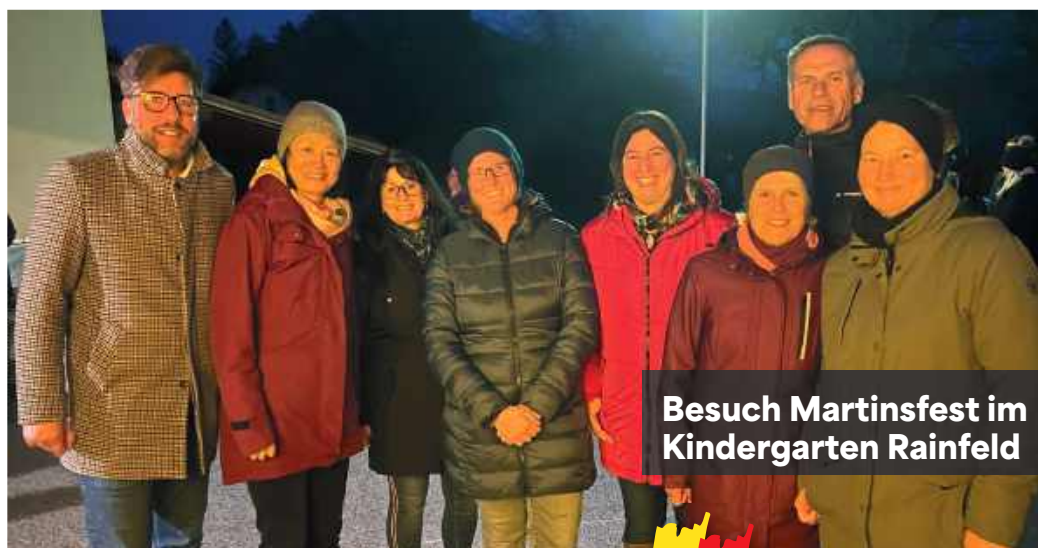
Besuch Martinsfest im Kindergarten Rainfeld