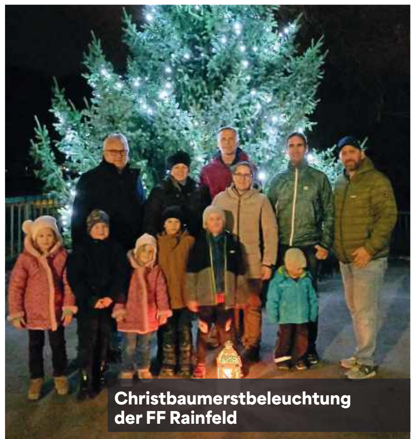
Christbaumerstbeleuchtung der FF Rainfeld