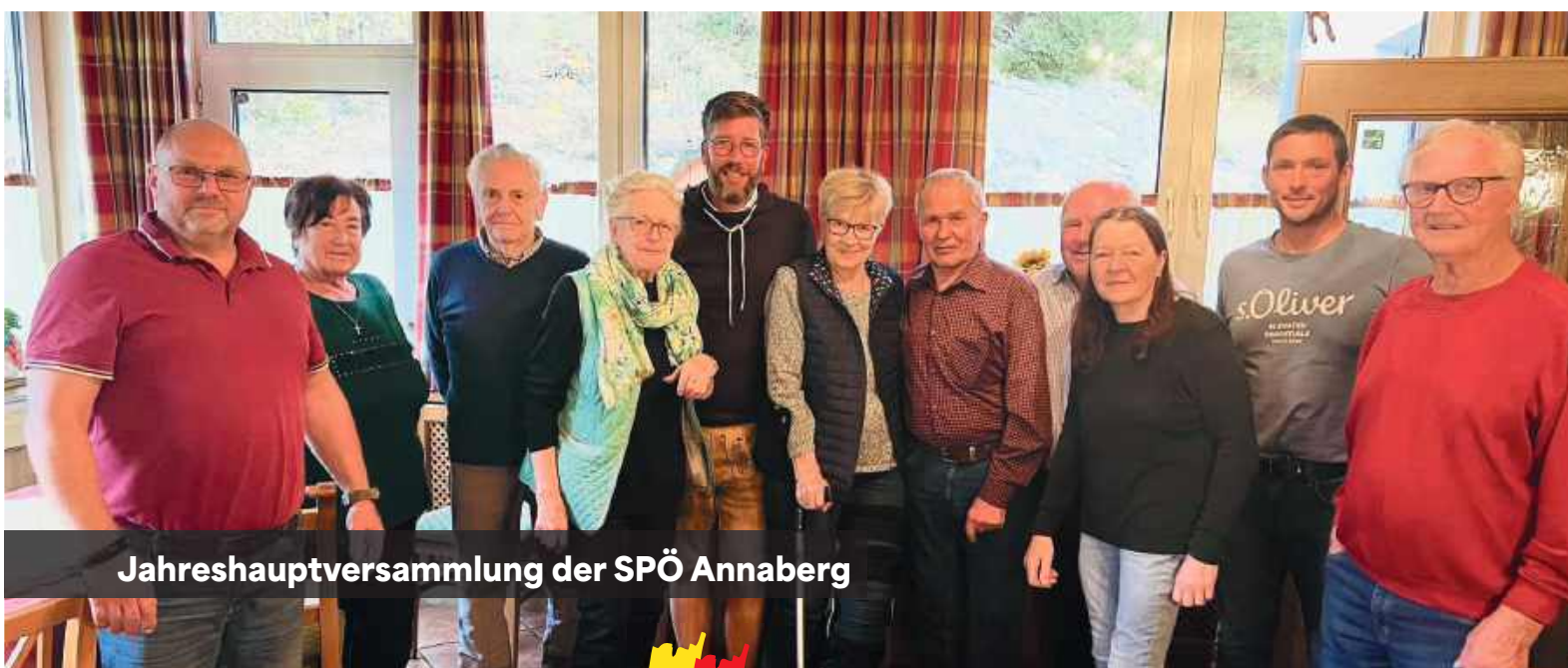
Jahreshauptversammlung der SPÖ Annaberg