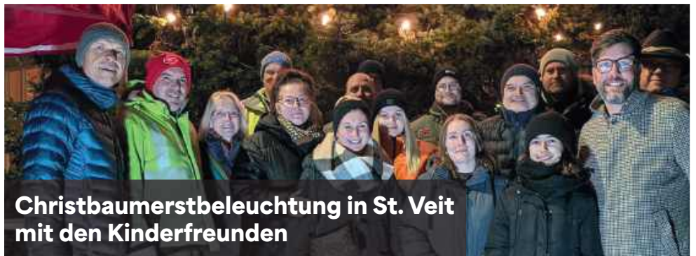
Christbaumerstbeleuchtung in St. Veit mit den Kinderfreunden