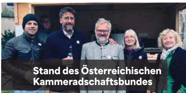
Stand des Österreichischen Kammeradschaftsbundes