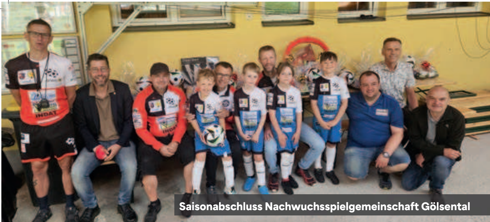
Saisonabschluss Nachwuchsspielgemeinschaft Gölsental