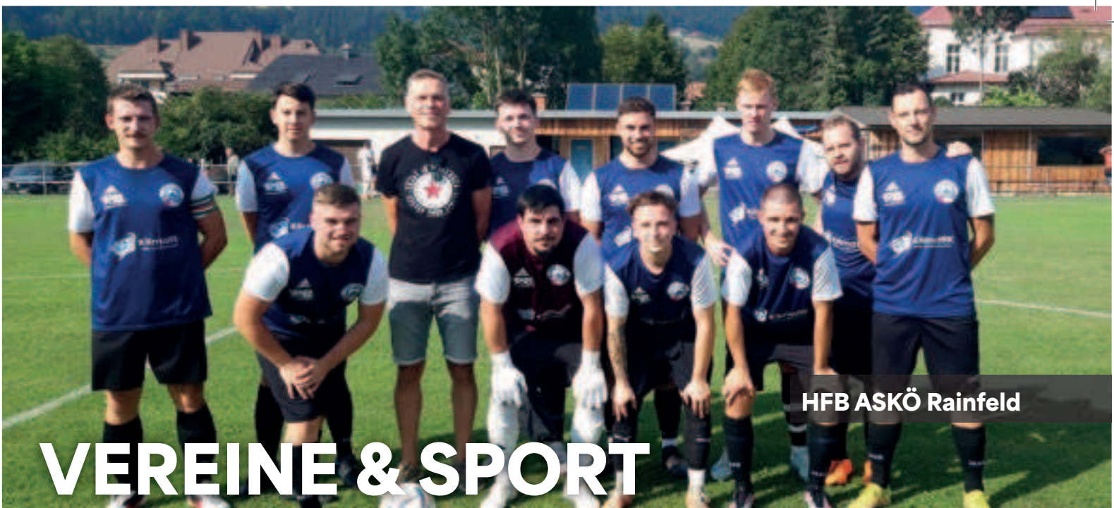
HFB ASKÖ Rainfeld