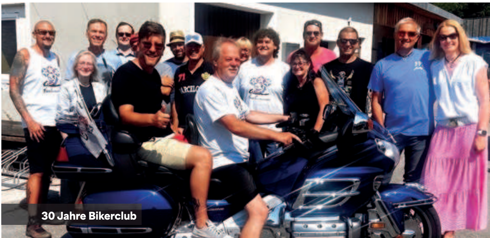
30 Jahre Bikerclub