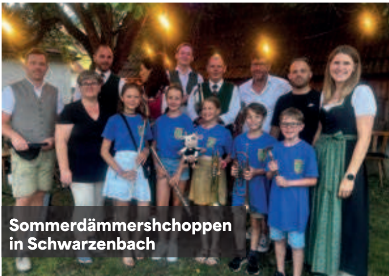
Sommerdämmerhchoppen in Schwarzenbach