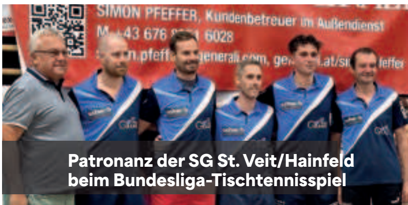
Patronanz der SG St. Veit/Hainfeld beim Bundesliga-Tischtennisspiel