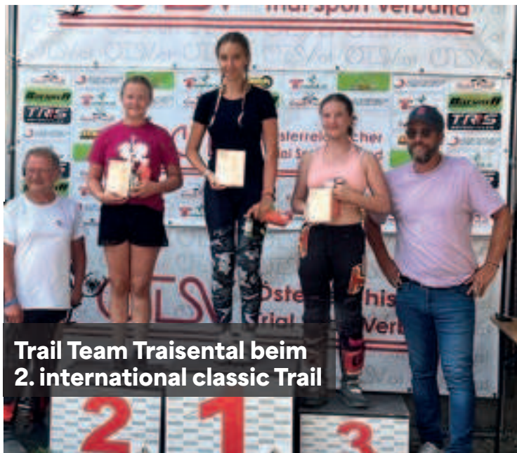
Trail Team Traisental beim 2. international classic Trail