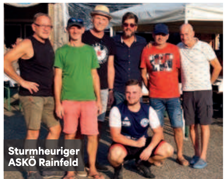
Sturmheuriger ASKÖ Rainfeld