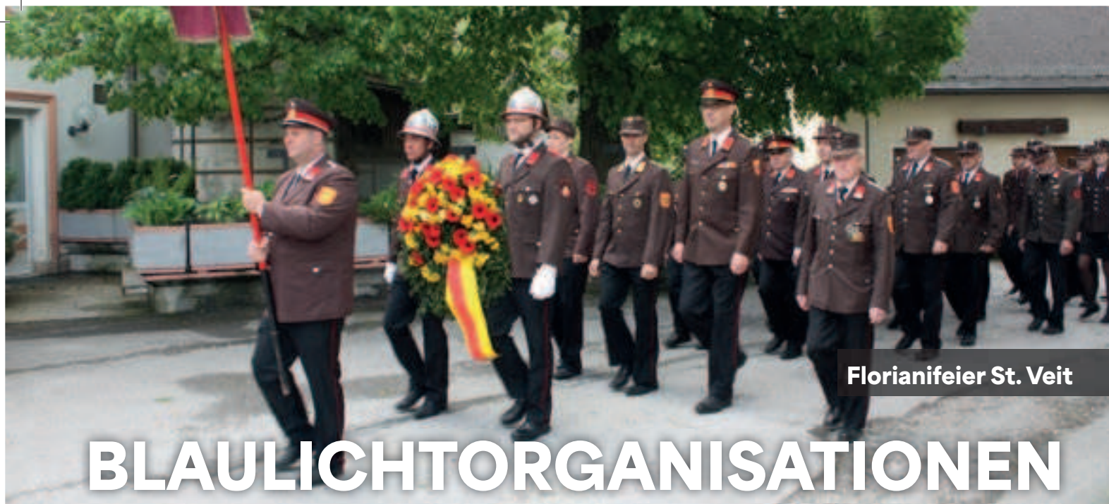
Florianifeier St. Veit