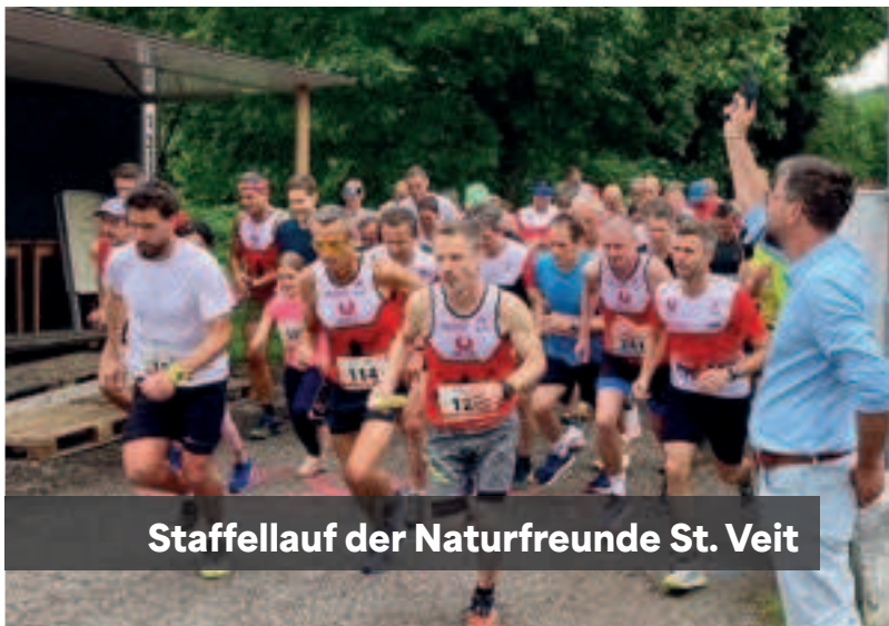
Staffellauf der Naturfreunde St. Veit