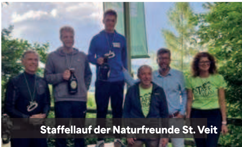
Staffellauf der Naturfreunde St. Veit