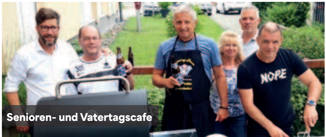
Senioren- und Vatertagscafé

Ein herzliches Dankeschön an alle, die sich aktiv für unsere Senioren und die Gemeinschaft einsetzen!