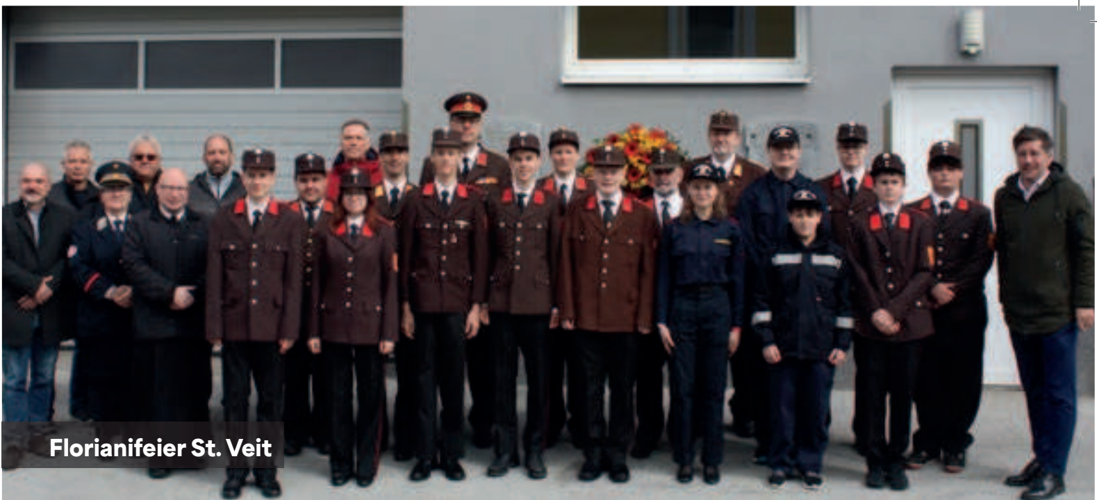
Florianifeier St. Veit