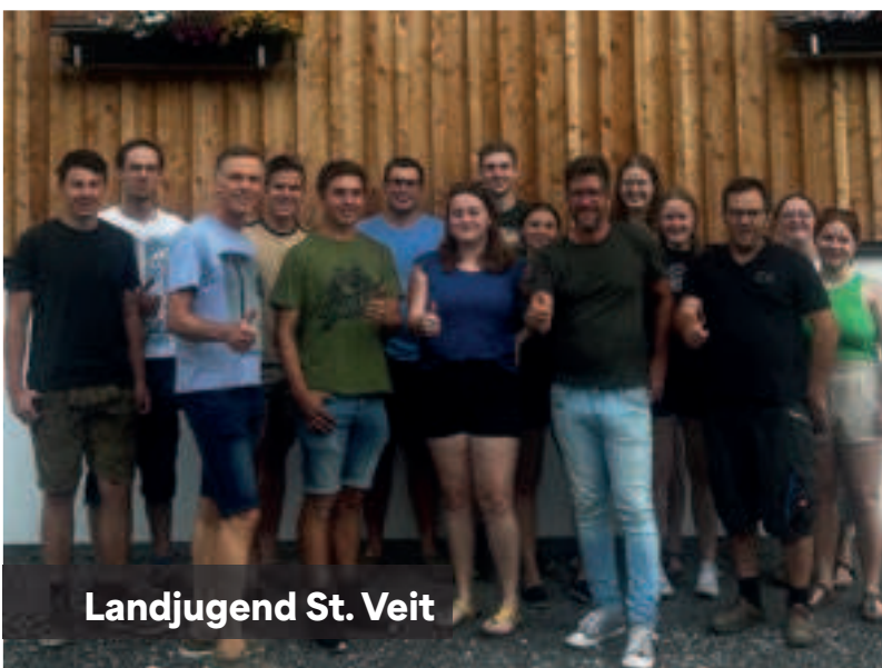
Landjugend St. Veit

Sport und Vereinsleben gehen in St. Veit Hand in Hand – ein großes Dankeschön an alle, die das Gemeindeleben so aktiv und lebendig gestalten!