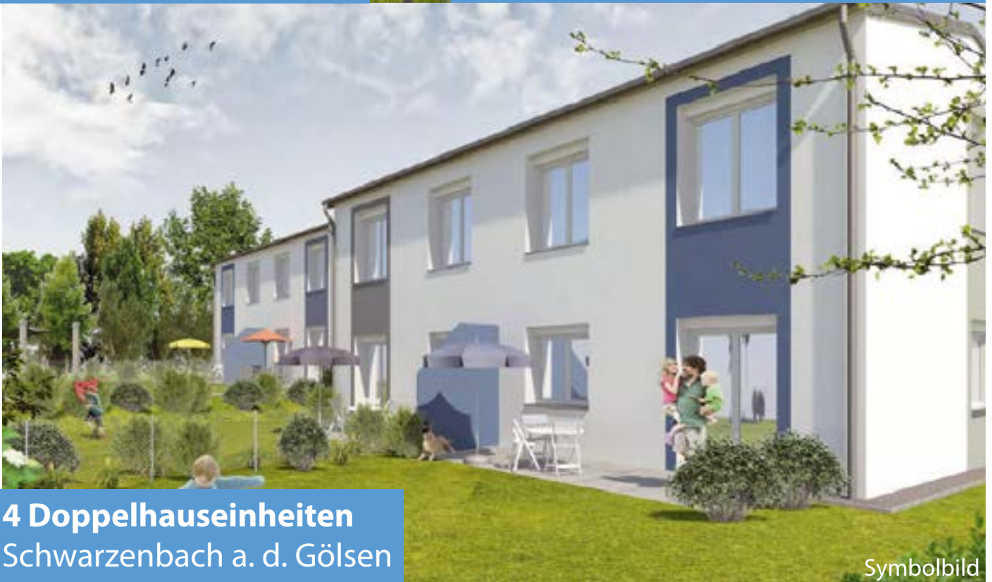
4 Doppelhauseinheiten Schwarzenbach a. d. Gölsen

Errichtet für die Marktgemeinde St. Veit/Gölsen