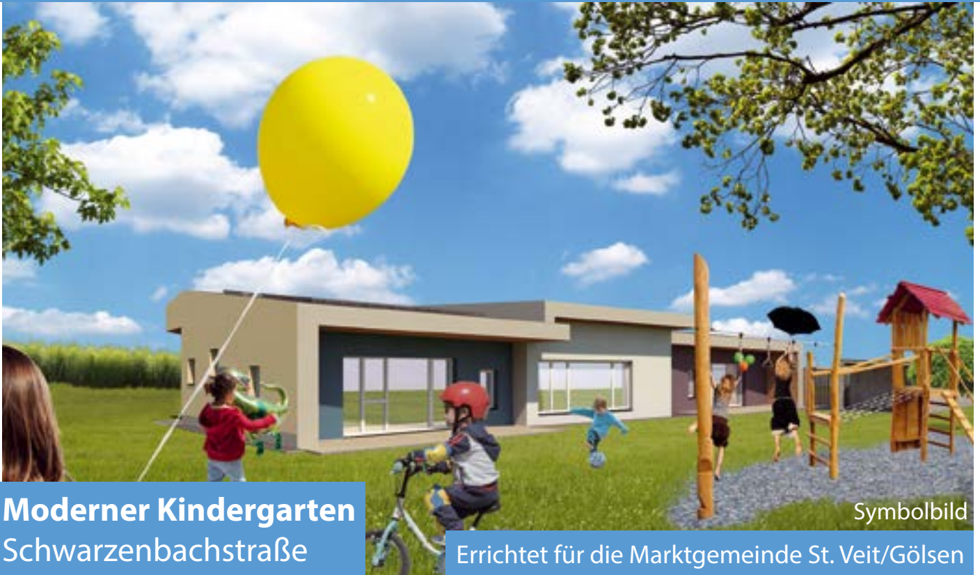
Moderner Kindergarten Schwarzenbachstraße